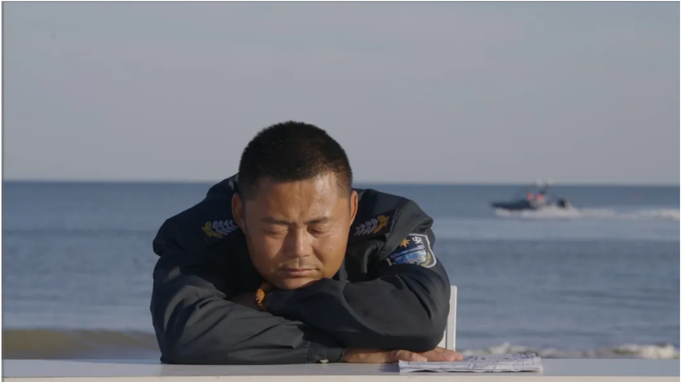
姚清妹，《安》，2021年，影像，7分57秒